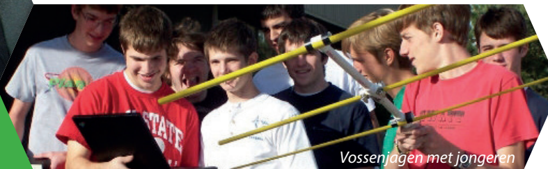
Vossenjagen met jongeren

Je kunt bijvoorbeeld mee doen aan wedstrijden, deze kunnen net zo spannend zijn als een goed potje voetballen. Zo kan het net zoals bij voetballen draaien om het maken van de meeste verbindingen (punten) of zoals bij speerwerpen het maken van de verste verbinding (afstand).