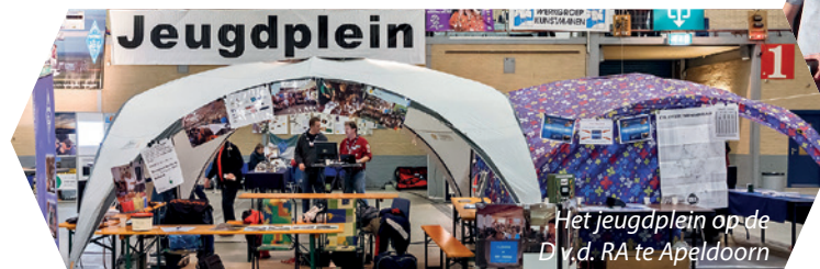
Het jeugdplein op de D.v.d. RA te Apeldoorn