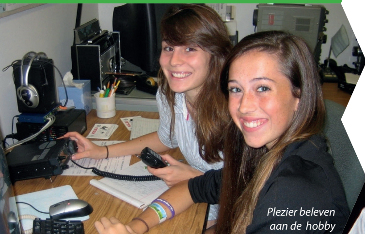
Plezier beleven aan de hobby