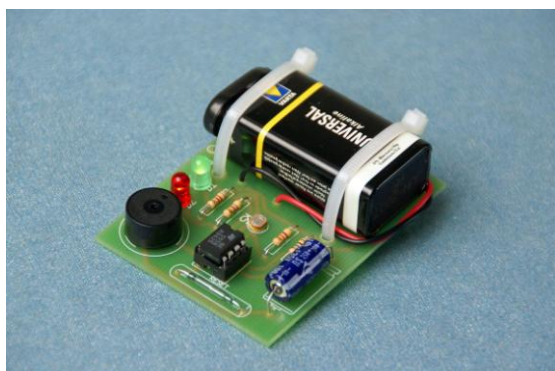
De Lasergame uit 2007

Op veler verzoek hebben we de lasergame weer in productie genomen. Het bouw pakket was in 2007 zo populair dat het binnen de kortste keren was uitverkocht. De nieuwe lasergame is voorzien van verschillende verbeteringen die ons zijn aangedragen door de deelnemers. Zo is de glazen schakelaar vervangen en is deze lasergame naast met een zaklamp ook bruikbaar in combinatie met een oude infrarood afstandbediening die je uit de rommelbak vist of voor een paar cent bij de kringloop vandaan haalt.